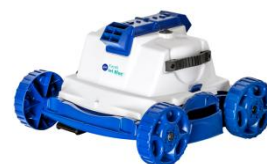
Robot Robot RKJ14