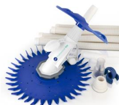
Limpiafondos automático Automatic cleaner 19007